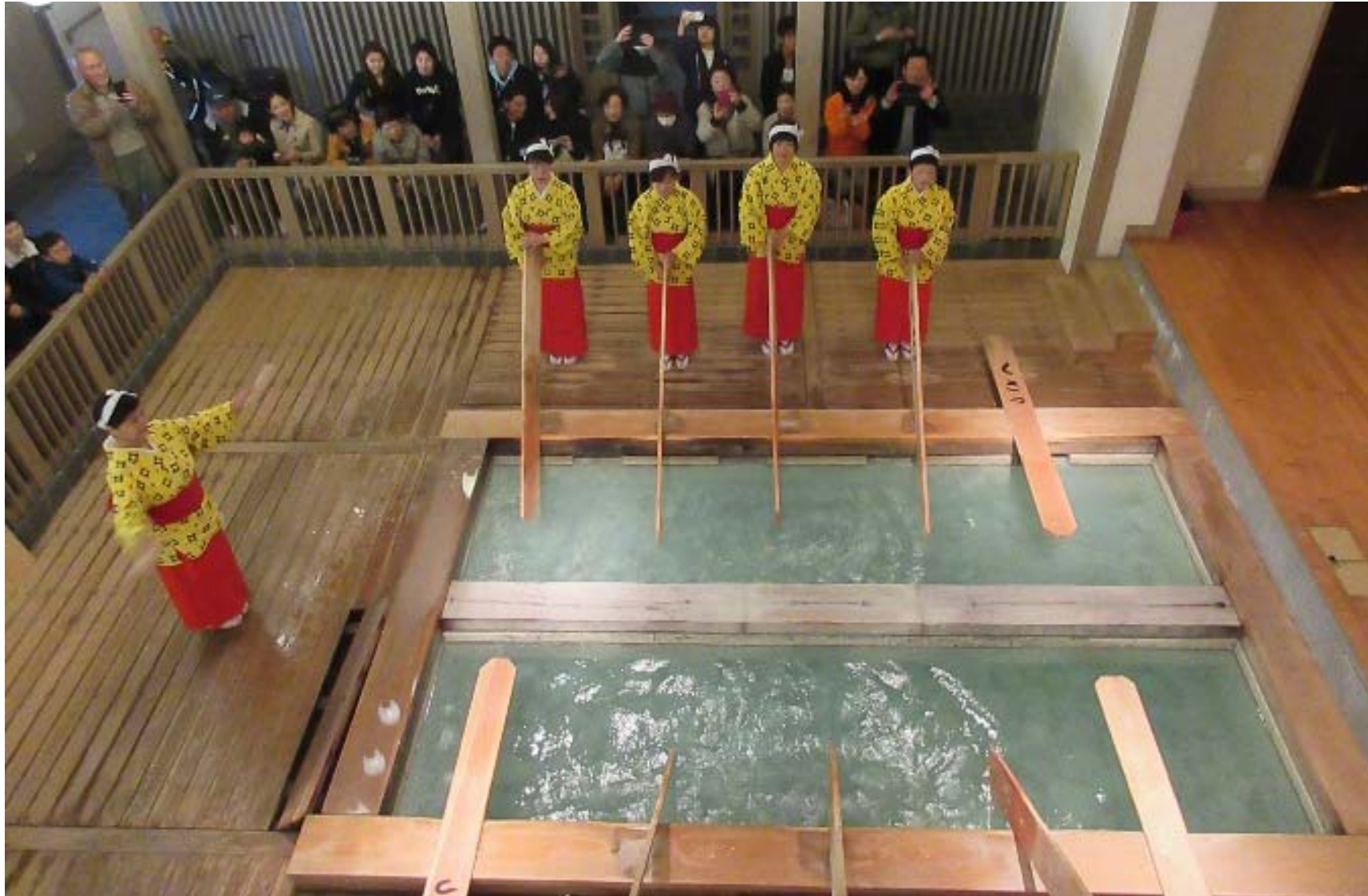
熱之湯の「湯もみショー」