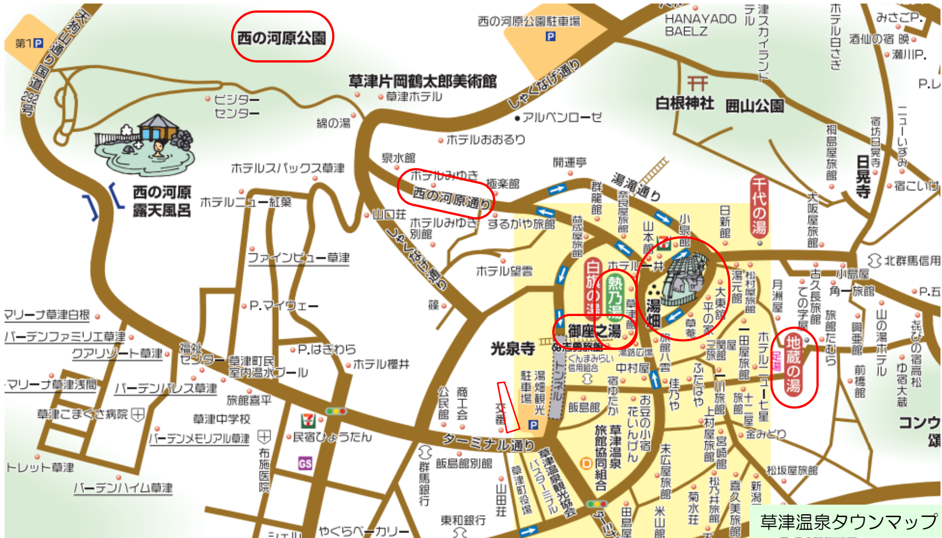
草津温泉タウンマップ