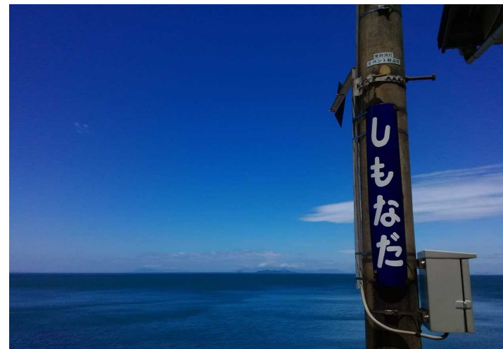
JR下灘駅からの風景(上)(下)