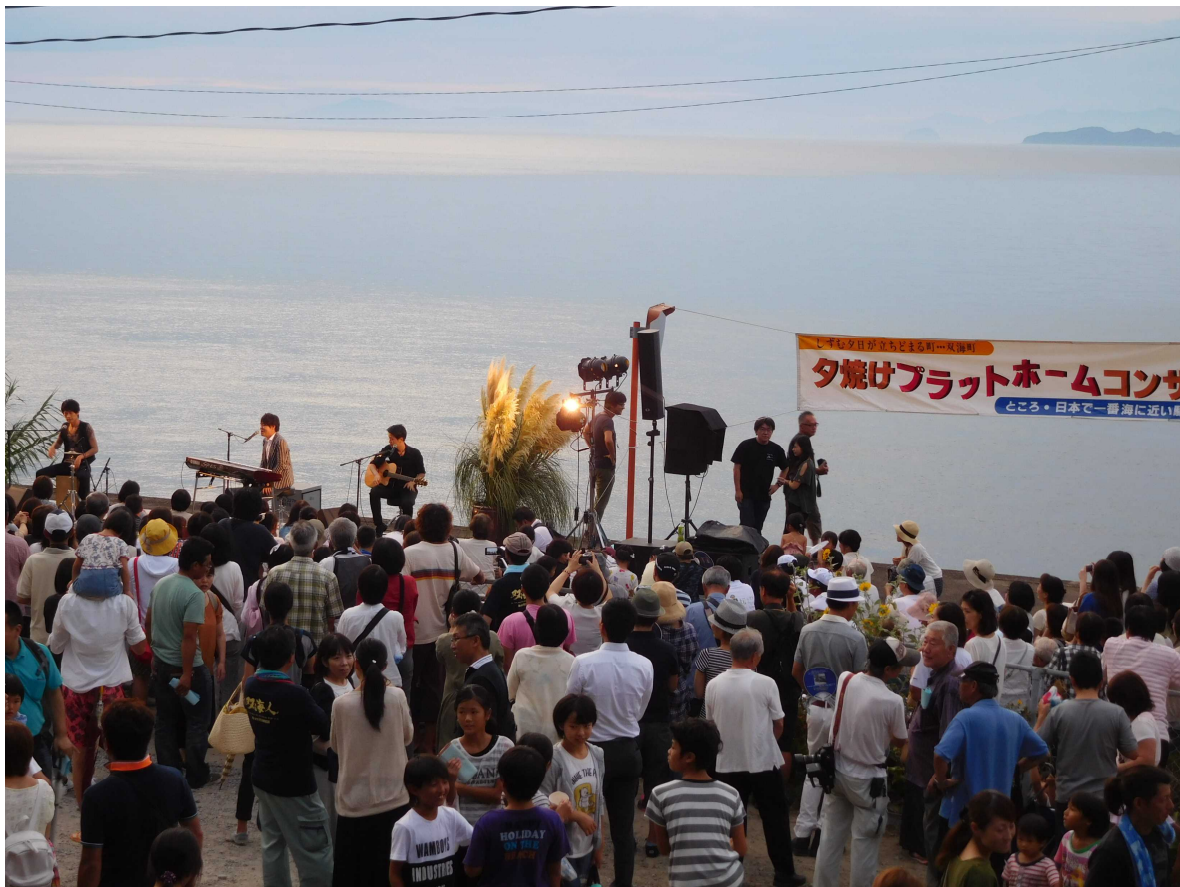
JR予讃線下灘（しもなだ）駅にて開催