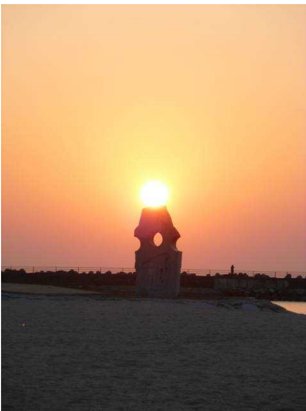
双海シーサイド公園の夕日